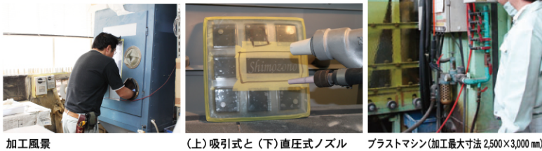
加工風景 (上)吸引式と(下)直圧式ノズル ブラストマシン(加工最大寸法 2,500×3,000 mm)

当社では、「直圧式」と「吸引式」のサンドブラストマシン(彫刻機)を使い分け、立体的で表情豊かに仕上げております。多彩な造形美と高品質な商品づくりのため、設備を充実し、こだわって製作しております。